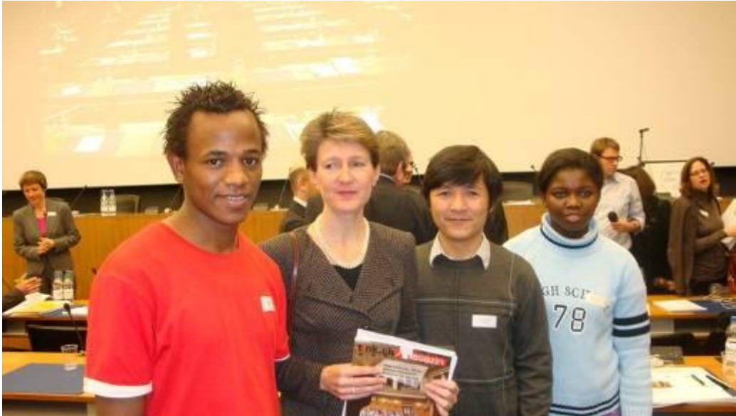
Die Teilnehmenden von Speak out begegnen am Asylsymposium Bundesrätin S. Sommaruga.