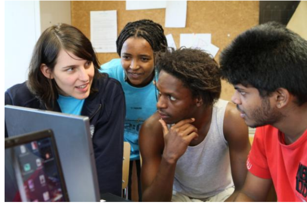
Die Teilnehmenden entwickelten ein Wörterbuch im Rahmen der Aktion 72 Stunden.